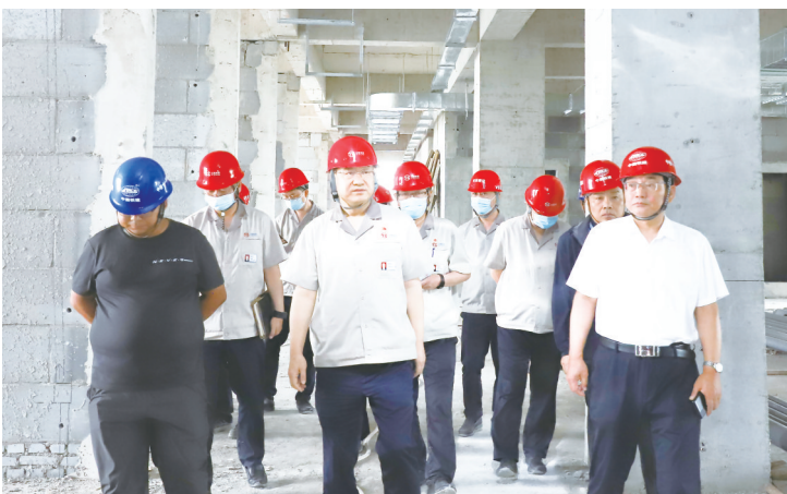
在运营中心建设现场

大意义,以高度的责任感和使命感,紧盯目标任务,主动谋划、系统谋划、前瞻谋划,全面协调解决好项目建设的图纸、人员、机具、材料等问题,倒排工期、挂图作战、科学施工;要强化时间观念和效率意识,打好提前量,抓住重点核心,分清轻重缓急,抓实、抓细、抓好全方位各环节,保证项目投产务期必成。能源供应是生产运行的前提和保障,综合泵站是当前项目建设的重中之重,要注重统筹调度、有序衔接,全力做好新园区投产前的后勤、能源保障准备工作。